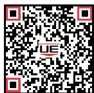
Hoja de datos (TCD-B)