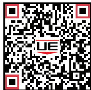
Manual de instalación y operación (IM_TCD50)