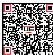
IEC 60079-29-1 Guía de integración del usuario (UIG_TCD)