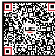
Manual de instalación y operación (IM_TCD60)